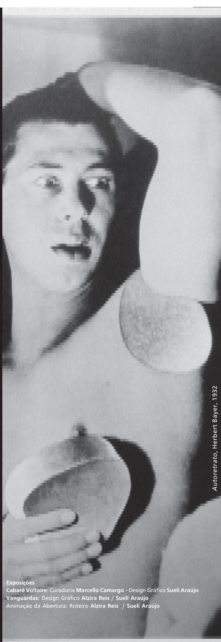
Autoretrato, Herbert Bayer, 1932

Foto da capa: Étude chronophotographique de la locomotion humaine , Étienne-Jules Marey, 1886